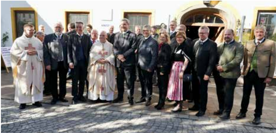
Traditionell das Gruppenbild vor dem Beginn des Gottesdienstes