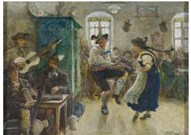
Schuhplattler (Bavarian Dance), Hubert von Herkomer, 1875

Liesl Karlstadt (eigentlich Elisabeth Wellano, 1892–1960) war ein musikalisches Multitalent und Karl Valentins kongeniale Partnerin. Markenzeichen der gemeinsamen Auftritte waren Couplets, Clownereien und musikalische Sketche. Nachdem sie sich zunehmend von Karl Valentin gelöst hatte, verzeichnete sie als Volksschauspielerin solo große Erfolge.