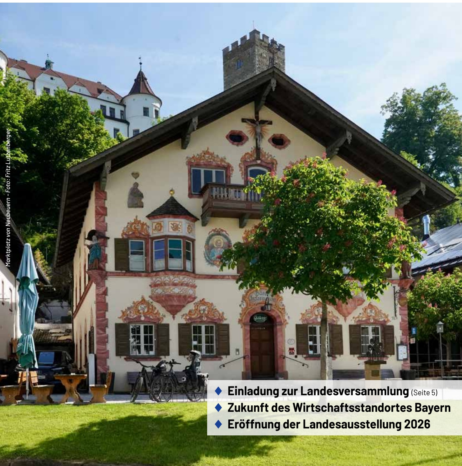
Marktplatz von Neubuern

Zeitschrift des Bayernbund e.V. fr Altbayern, Franken und Schwaben