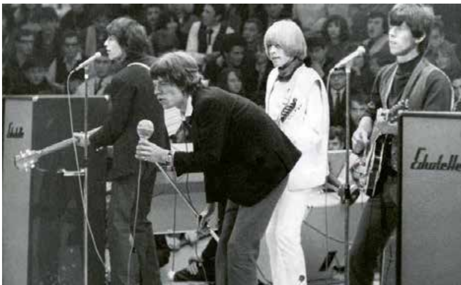
Rolling Stones im Circus Krone,

Ein Paar tanzt in einer Wirtsstube in bayerischer Tracht einen Schuhplattler, beobachtet von den Menschen im Hintergrund, offensichtlich städtisches Publikum. Begleitet werden sie von einem Trio mit zwei Gitarren und einer Zither. Tracht, Schuhplattler und Volksmusik entwickeln sich in der zweiten Hälfte des 19. Jahrhunderts zum unverkennbaren Markenzeichen Bayerns.