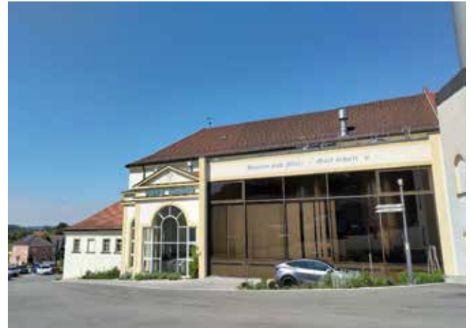
Brauerei Aldersbach.

gischen Motiven versehen und können durch Drehen passend zu den Abläufen des Kirchenjahres gewechselt werden. Auch die mittig zierende Schutzpatronin Maria kann per Aufzug nach unten abgelassen und gegen den auferstandenen Herrn getauscht werden. Auch die Belichtung und die Klimatisierung war bereits zur damaligen Zeit sehr durchdacht. Besonders hervorzuheben ist die hervorragende Akustik der Kirche.