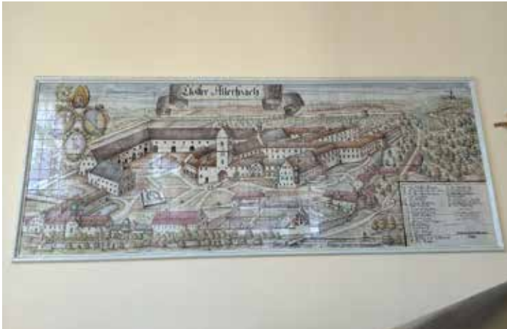
Stich der historischen Klosteranlage Aldersbach