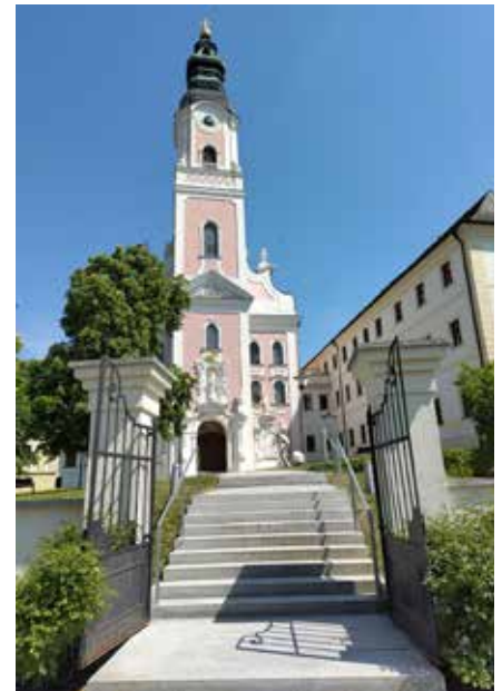
Kirchenportal und Kloster Aldersbach.

Das prächtige Kirchenportal mit dem Gründer des Zisterzienserordens, dem