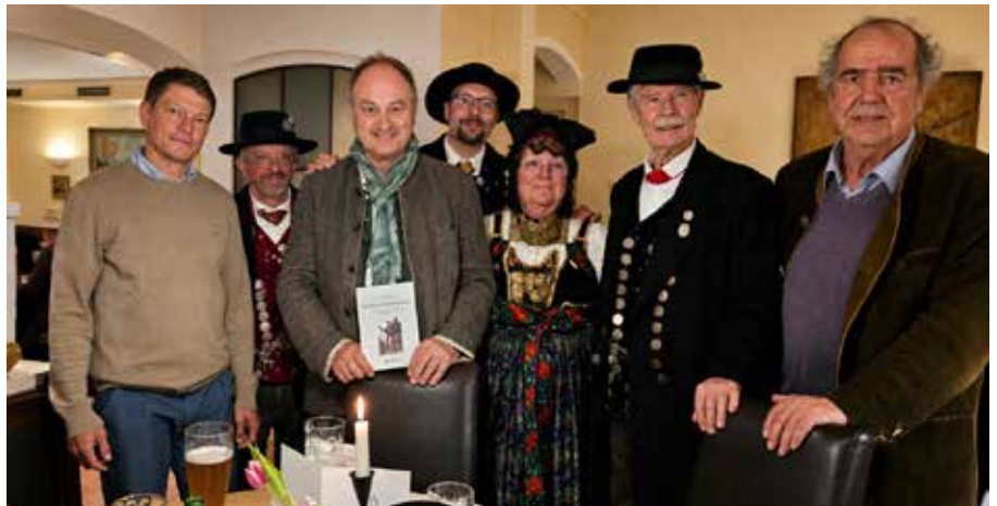
Geselliges Beieinandersein in der Schlosswirtschaft.