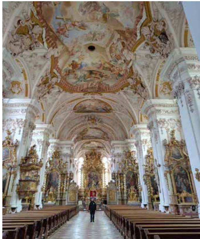
Innenansicht Asamkirche Aldersbach.

Die Aldersbacher Kirche durchlebte eine wechselvolle Geschichte. So war sie zunächst eine reine Klosterkirche und nur den Mönchen zugänglich und diente der täglichen Messfeier, speziell an der Vielzahl der Seitentäpfe. Auch das Gestühl war zu diesem Zeitpunkt noch nicht vorhanden. Dieses kam erst im 19. Jahrhundert in die Kirche. Nach der Säkularisation wurde sie zeitweise sogar als Pferdestall genutzt. Da die Aldersbacher mit ihrer Kirche sehr verbunden waren, ging Ihnen diese Umnutzung doch zu weit. Kurzerhand trugen sie in einer Nacht- und Nebelaktion die bis dahin genutzte Dorfkirche ab und führten die bisherige Klosterkirche wieder ihrer Bestimmung als Kirche