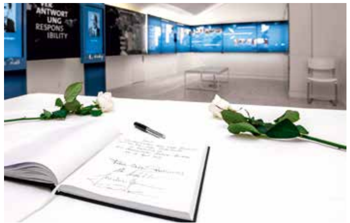
Dauerausstellung in der Denkstätte Weiße Rose

Säkularisation und Mediatisierung, beide bestimmend für die Ausbildung des modernen Bayern im 19. Jahrhundert, hatten einen Kahlschlag der Bildungseinrichtungen im Gefolge. Die politischen Umwälzungen am Beginn des 19. Jahrhunderts bedeuteten für die Universitäten „die schwerste Existenzkrise und umwälzendste Reformära“ (Laetitia Boehm). Die von den fortschrittlichen Aufklärern im Gefolge des Ministers Max Joseph von