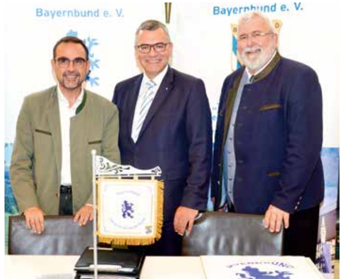
Der Bayernbund im Gespräch mit dem CSU-Fraktionsvorsitzenden Klaus Holetschek und Staatsminister Dr. Florian Herrmann