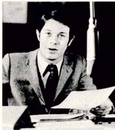
Funksprecher von Rautenberg Preußisches Rrrr nicht abgewöhnt

Zu den Folgen unseres Aufbegehrens gehört auch, dass v. Rautenberg mit seiner Rausschmiss-Affäre zum Spiegel ging und so unsere Demo zur Grundlage wurde für eine deutschlandweite Berichterstattung (Spiegel, Heft 51 vom 14. Dezember 1970, S. 90, folgende wörtlichen Zitate kursiv). Unter der Überschrift „RUNDFUNK Bayern Punkt bumms“ wurde die Entlassung des norddeutsch artikulierenden Sprechers als „Konzession an einen bayerischen Traditionalistenver-