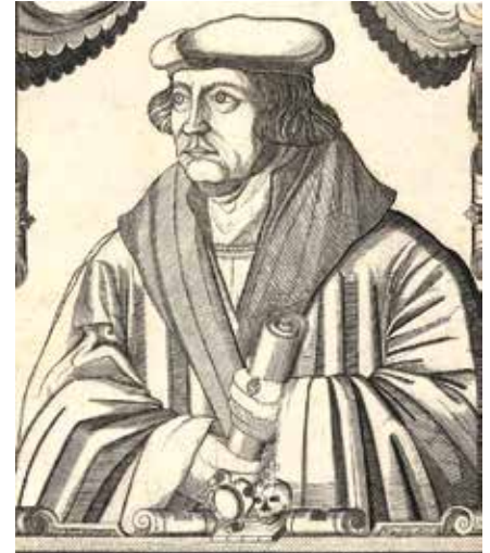
Professor Johannes Eck

Mit der Vereinigung Ober- und Niederbayerns nach dem Landshuter Erbfolgekrieg war die Ingolstädter Universität unter die Herrschaft Herzog Albrechts IV. des Weisen und seit 1508