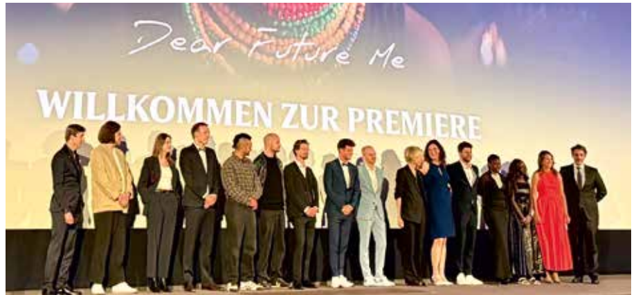
Der anwesende Teil der Filmcrew konnte den begeisterten, aber auch nachdenklichen Applaus der Zuschauerinnen und Zuschauer entgegennehmen.

Die Münchner Premiere brachte Filmschaffende, Vertreter aus Politik, Medien und Zivilgesellschaft zusammen. Die Gespräche nach der Vorführung waren geprägt von Betroffenheit – und von der Frage nach Verantwortung. „NAWI – Dear Future Me“ entfaltet seine größte Wirkung nicht durch Preise, sondern in den Lebensgeschichten von Mädchen, die heute eine Chance