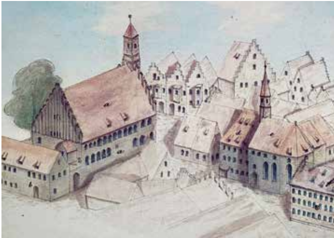
Hohe Schule zu Ingolstadt

(1515–1585) an der Theologischen Fakultät. Albrecht V. stiftete 1555 ein Kolleg, worauf die Jesuiten im folgenden Jahr bereit waren, zunächst die Theologische Fakultät und später auch die Artistenfakultät zu übernehmen. Sie gestalteten Ingolstadt zu einer Musteranstalt katholischer Bildung, die weit über Bayern ausstrahlte. Zur Finanzierung des Jesuitenkollegs wurden ihm aufgelassene Klöster übertragen, weshalb es Sitz und Stimme unter den bayerischen Landständen erhielt. Ingolstadt wurde zur wichtigsten Ausbildungsstätte für Priester, aber auch Fürstensöhne und Juristen in Oberdeutschland.