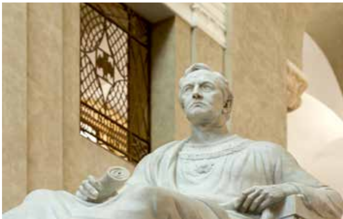
Statue von König Ludwig I. von Bayern im Lichthof der LMU

Im Frühjahr 1814 ging die bayerische Regierung an die Neuorganisation der Hochschullandschaft. Sie bestand in der Übertragung der 1804 publizierten und 1813 revidierten Landshuter Universitätsgesetze auf die beiden anderen Landesuniversitäten Erlangen und Würzburg. Eine Stärkung erfuhren diese durch die Verfassung des Königreichs vom 26. Mai 1818, gemäß der jede der drei bayerischen Universitäten ein Mitglied in die Abgeordnetenversammlung der Ständeversammlung zu entsenden hatte.