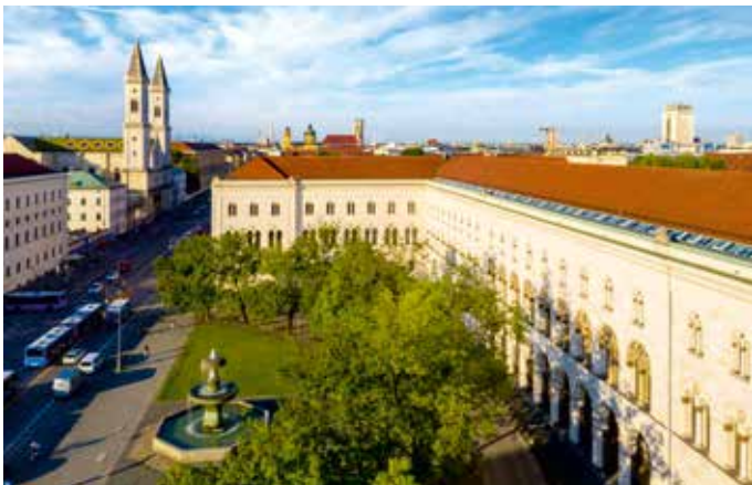
Hauptgebäude am Geschwister-Scholl-Platz

Traditionsreiche und renommierte Universitäten begehen ihre Jubiläen meist mit akademischen Festakten, wissenschaftlichen Colloquien, umfangreichen Festschriften und historischen Forschungen zu ihrer Geschichte, Quelleneditionen und Ausstellungen. Zu diesem illustren Kreis gehört ohne Zweifel die Ludwig-Maximilians-Universität München, deren Gründung im Jahr 1472 erfolgte. Herzog Ludwig IX. der Reiche von Bayern-Landshut (1450–1479) ließ damals in der zeitweiligen Residenzstadt des bayerischen Teilherzogtums Ingolstadt eine Universität eröffnen.