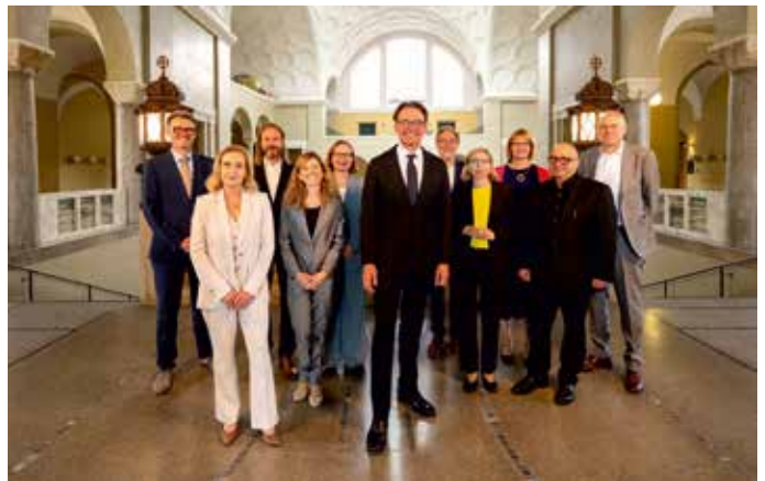
Hochschulleitung der LMU

Die Ludwig-Maximilians-Universität gehört in internationalen „Rankings“