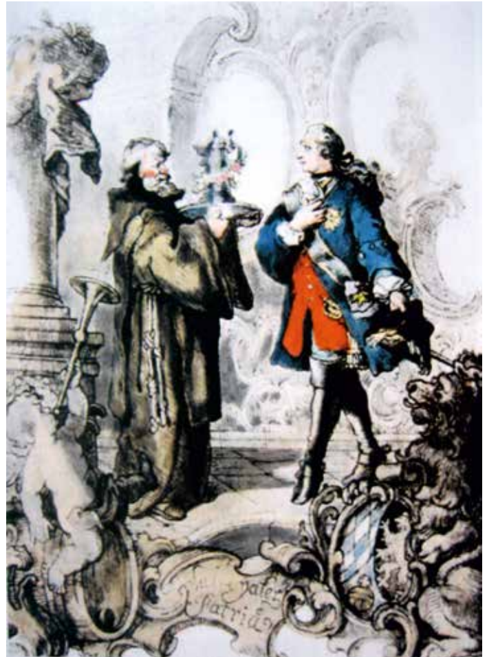
Wikipedia, Valentin Stephan Still, gemeinfrei, Datei: Eduard Ille Kredenz-Szene.jpg

Mit dem Ziegenbock hatte das Bier nie etwas zu tun, der Name ist schlicht eine bayerische Form der umständlichen Bezeichnung. So wurde aus ainpöckisches über oanböckisches und böckisches Bier im Laufe der Zeit nur Bockbier, noch kürzer Bock. Das herzogliche bzw. kurfürstliche Monopol für Weißbier und Bockbier wurde 1780 aufgegeben. Vorher war es schon den Paulanermönchen erlaubt, für den Eigenbedarf zu brauen, nun durfte das Bier auch nach außerhalb des Klosters verkauft werden. Aus dem dem Klosterbier angemessenen Namen Sankt-Vater-Bier wurde dann der eher weltliche Name Salvator;