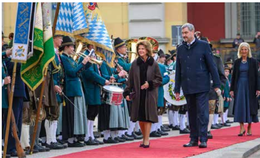
Der Spielmannszug und die Musikkapelle der Gebirgsschützenkompanie Beuerberg-Herrnhäusen beim Empfang Ihrer Majestät Königin Silvia von Schweden.

In seiner Ansprache bezeichnete Ministerpräsident Söder den Besuch als große Ehre für Bayern. Königin Silvia sei eine zeitlose Ikone, die mit Wär-