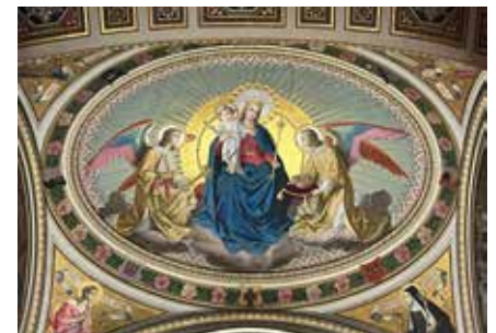
Maria Patrona Bavariae

Im Zentrum des in Rom umgesetzten Programms wie in Jerusalem thront die Jungfrau Maria als Patrona Bavariae. Gläubige aller Zeiten haben die Gottesmutter mit unterschiedlichen Namen und Titeln geehrt, variierende Eigenschaften betont und ihr gehuldet. In Bayern kulminierten ältere Verehrungsformen unter Kurfürst Maximilian I., der zunächst seine Residenz, dann seine Hauptstadt und das ganze Land unter den Schutz der Patrona Bavariae stellte. Dieser altertümliche Titel hatte auch politische Implikationen, bezog er doch das ganze frühmittelalterliche Herzogtum mit ein. 1638 ließ er auf dem Münchner Schranneplatz nach römischem Vorbild die Mariensäule aufrichten.