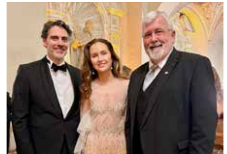
Aus der Spitze der bayerischen Gesellschaft: S.K.H. Prinz Ludwig von Bayern und seine Ehefrau Prinzessin Sophie-Alexandra von Bayern

spitze bleiben“, betonte der Ministerpräsident. Zukunft und Fortschritt müssten dabei stets mit Tradition und Heimat verbunden werden.