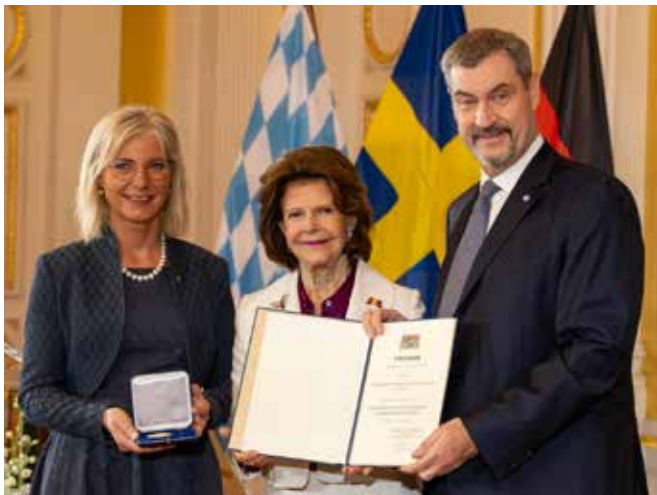
(v.l.): Sozialministerin Ulrike Scharf und Ministerpräsident Dr. Markus Söder zeichnen ihre Majestät Königin Silvia von Schweden mit der Bayerischen Staatsmedaille für Soziale Verdienste aus.