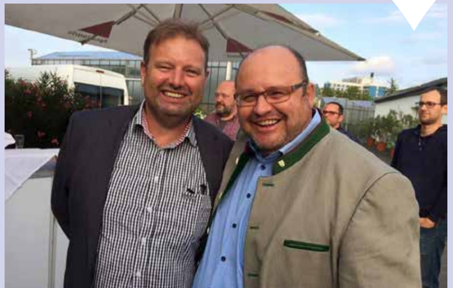
Mit großer Freude begrüßen wir den 3. Bürgermeister der Stadt Fürth, Dietmar Helm im Bayernbund e.V. Bezirksverband Franken. Unser Mitglied Nr. 50. Herzlich willkommen im Bayernbund.