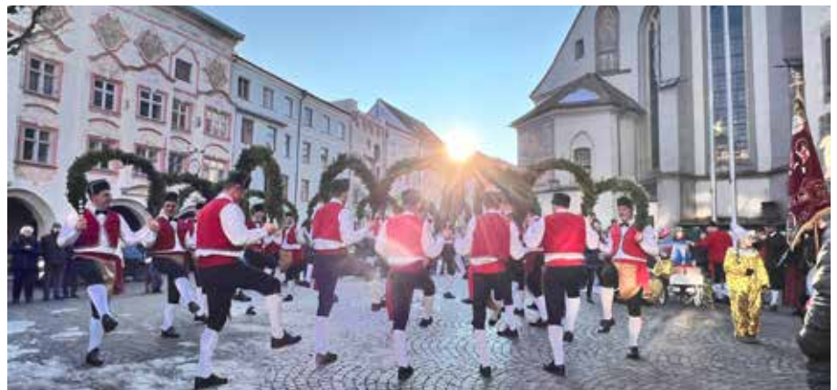
Schäffler tanzen am Marienplatz in Wasserburg am Inn

Mit der Miesbacher „Habererschlacht“ von 1893, bei der die Polizei dem Treiben unter Schusswaffengebrauch ein jähes Ende bescherte, verschwand dieser Brauch allerdings zusehends in der Bedeutungslosigkeit.