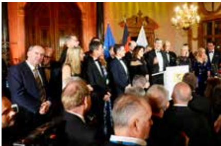
Ministerpräsident Dr. Markus Söder begrüßt die Gäste in der Residenz.

Mit festlichem Glanz eröffnete der Freistaat am 9. Januar 2026 das politische Jahr.