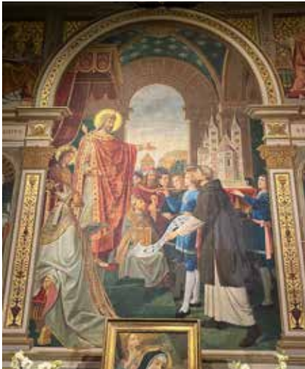
Kaiser Heinrich II. stiftet das Bistum Bamberg.

Entwürfe in Rom aus. Für die Auswahl der dargestellten Heiligen und ausgewählter Szenen aus ihrem Leben stützte er sich wahrscheinlich auf die zweibändige Bavaria Sancta des Freisinger Theologieprofessors Magnus Jocham. Den Hinweis auf diese Bayernkapelle wie die Photoaufnahmen verdanke ich Michael Hetz.