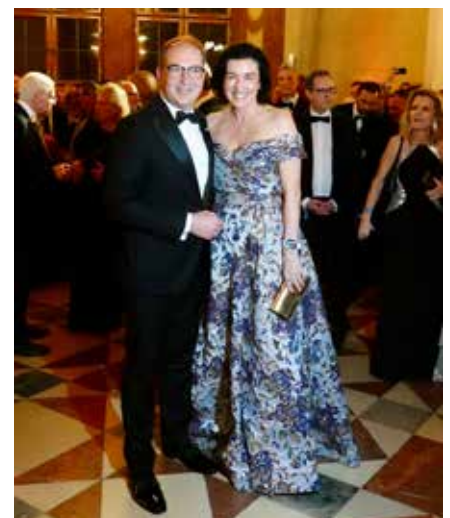
Aus Berlin waren die CSU-Minister Alexander Dobrindt und Dorothea Bär angereist.